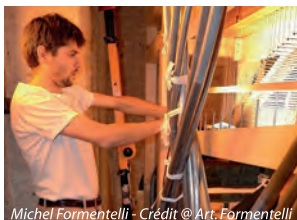
Michel Formentelli

Il se replace dans l'esthétique néo-classique et les recherches caractéristiques de l'après-guerre. Sa composition, sa disposition lui permettent de se consacrer à un vaste répertoire qui fera la part belle au grand répertoire symphonique des dix-neuvième et vingtième siècles.